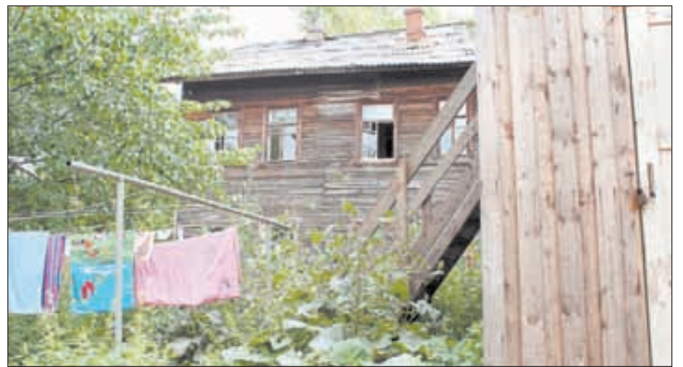
◆ Неплательщиков предлагают переселить в жилье, которое им «по-карману».

пояснили в департаменте ЖКХ по Кировской области. На этот случай в проекте закона предусмотрено решение: суд вправе обязать управляющую компанию предоставлять неплательщикам на время продажи квартиры жилье по договору найма в пределах того же населенного пункта. Ситуацию не спасут даже дети, они не станут смягчающим обстоятельством для неплательщика при выселении.