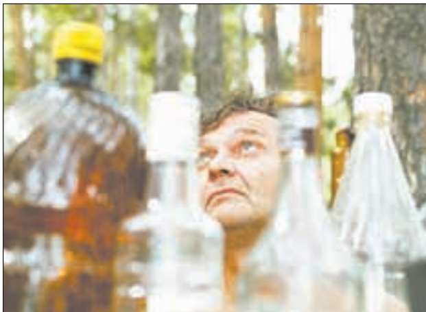
♦ С регулярными запретами на винопродукцию алкоголизация населения вряд ли угрожает.

Некоторые эксперты считают, что, как и в прошлый раз, Молдавия провинилась не только качеством вина. Недавно и.о. президента этой страны Михай Гимпу официально