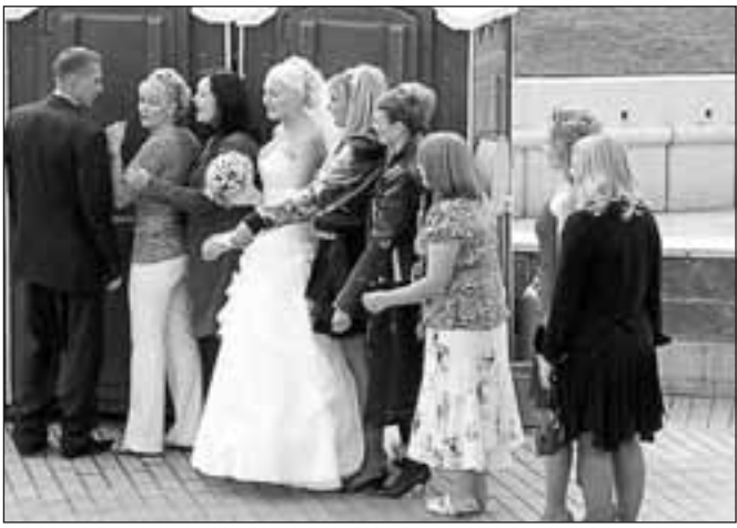
♦ Россия стоит не только в «пробках», но и в очередях за самым необходимым.